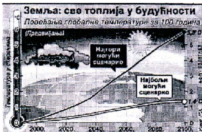
Slika 1. Zemlja: sve toplija u budućnosti

Ovako dobijeni podaci, do kojih je komisija došla poražavajući su po svetsku zajednicu, pa naučnici predviđaju velike poplave, jače oluje, i veći porast temperature na globalnom planu od 1,4 do 5,8°C u narednih 100 godina, što bi predstavljalo pravu katastrofu za čovečanstvo.